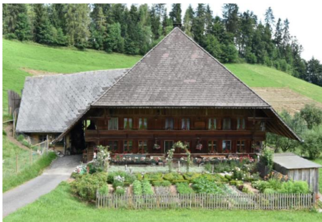
Geburts- und Wohnhaus von Niklaus Leuenberger